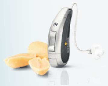
Siemens Pure micon: Größenvergleich – Abbildung in Originalgröße.